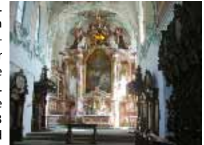
Kirche - Hochaltar

Wir verlassen die Kartause durch den grossen Torbogen auf der Südseite und folgen erst der Strasse nach