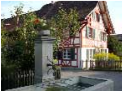
Dorfbrunnen in Oberstammheim

noch der Flurname von diesem Gotteshaus.