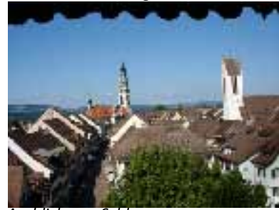
Ausblick vom Schloss

Patrizier- und Bürgerhäuser aus dem 17.-18. Jahrhundert.