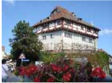
Schloss mit dem Bergfried