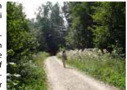
Randen - Waldweg

Auf Forstwegen wandern wir in südwestlicher Richtung weiter über Guger, Zelgli und Mösli (836m). Dann geht es in südöstlicher Richtung, über die Strasse (die hinunter nach Siblingen führt) bis zum Waldweg, auf dem wir, eine Stunde nachdem wir Talisbänkli verlassen haben, zum Rastplatz Hägliloo, kommen. Dieser liegt auf 660m auf einer Lichtung mit schöner Aussicht. Beim Parkplatz an der Bergstrasse die von Beringen heraufkommt, nehmen wir links den Waldweg, auf dem wir durchs Altholz ins Eschheimertal gelangen. Rechts entlang des Waldrandes wandern wir an blühenden Wiesen vorbei leicht abwärts bis wir, 3/4 Stunden nachdem wir Hägliloo verlassen haben, zu den Parkplätzen Wolfsbuck und Gretzenecker (564m) kommen. Diese Parkplätze liegen am Ende der von Schaffhausen heraufkommenden Strasse. Auf ihr gehen wir bis nach Lahnbuck (536m), wo wir die Stras-