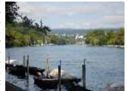
Langwiese mit Blick auf Munot

Wir überqueren bei der Schiffländte den Rhein (392m) und wandern auf der Zürcher- und Diessenhoferstrasse durch den Vorort Feuerthalen. Unter der Bahn hindurch kommen wir zum Rhein und erreichen nach 45 Minuten den Ort Langwiesen mit seinen Rastplatz und dem Ausblick zurück auf den Munot. Ab hier führt der schattige Weg entlang des Rheins, teils auf der breiten Ufermauer, in 20 Minuten zum Paradies. Bei der Rheinfähre steht der Gasthof Paradies, dann kommen wir, an einem Schaufelrad vorbei, zum ehemaligen Klarissenkloster Paradies. Dieses ist heute ein Schulungszentrum der Georg Fischer AG. Das Kloster wurde vom Kyburger Grafen Hartmann d.Ä. 1257 gestiftet. Die Klosterkirche St. Michael kann frei besichtigt werden. Das barocke Gotteshaus dient heute als Pfarrkirche der Gemeinde Schlatt. Der Weg wendet sich wieder dem Rhein zu und erreicht nach einigen