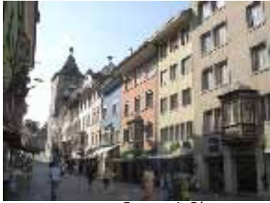
Gasse mit Obertorturm

se verlassen und zwischen Maisfeldern hindurch in Richtung Stadt wandern. Bald erreichen wir die ersten hübschen Villen und Einfamilienhäuser am oberen Hang von Schaffhausen. Es geht es steil abwärts. Aus dem Dunst tauchen die Türme der Altstadt auf. Dann gelangen wir in den Stadtteil Riet (475m), wo gerade der Stadtbus hält. Wir widerstehen der Versuchung und schaffen es in 25 bis zum Schaffhauser Bahnhof (403m).