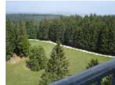
Panoramasicht vom Hagenturm

Wenige Meter nach der Grenze wird der Weg breiter. Vor uns liegt eine Strecke von rund 14 km bis nach Schaffhausen. Nach wenigen Minuten kommen wir zum Wegweiser, der uns eine Wanderzeit nach Schaffhausen von 2h 45min anzeigt. Wir verlassen kurz den Wanderweg und machen einen Abstecher zum Hagenturm hinauf. Von dessen Gitterplattform sehen wir bei klarer Fernsicht den Schwarzwald, die Berge des Allgäu, den Bodensee, den Säntis, die Glarner- und Urner Alpen sowie die Schneegipfel des Berner Hochgebirges. Wieder zurück auf dem Wanderweg geht es in südlicher Richtung weiter. Durch schattigen Wald kommen wir, am Hasenbuck (835m) und Heidenbomm (820m) vorbei, zum Talisbänkli (840m), das wir nach einer Stunde Fussmarsch erreicht haben. Zwischen Heidenbomm und Talisbänkli gehen wir eine Teilstrecke auf einer Strasse, bis wir auf den Wanderweg nach Talisbänkli abzweigen. Die Strasse führt rechts hinunter ins Tal nach Hemmental, von wo ein etwas kürzerer Wanderweg ebenfalls nach Schaffhausen führt. Im Talisbänkli treffen wir auf einen kleinen Pavillon mit Infotafeln über Fauna und Flora des Randen. Wir erfahren, dass an versteckten Orten der Frauenschuh gedeiht, der von Mai bis Juni blüht und dass es hier auch Gemsen gibt.