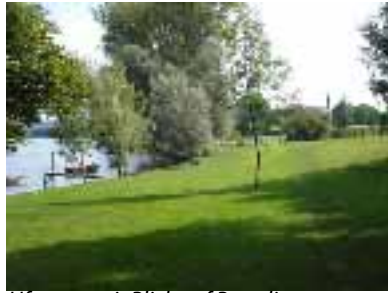
Uferweg mit Blick auf Paradies