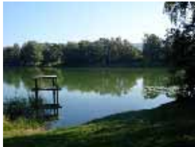
Nussbaumersee - Naturschutzgebiet

Bald zeigt ein Wegweiser nach links in Richtung Ürschhausen. Beim Seehof kommt der Weg für kurze Zeit auf die Strasse und führt vor einem grossen Parkplatz zum Nussbaumer-See hinunter. Wir finden dort einen kleinen Badeplatz mit Grillstelle. Auf dem Thurgauer Rundwanderweg kommen wir dem bewaldeten Seeufer entlang durch ein Naturschutzgebiet (440m). Hier erfahren wir, dass die ersten menschlichen Spuren im Seebachtal in die Zeit um 9000-5500 v. Chr. zurückreichen. Das erste Dorf entstand 4000 v. Chr. Nach dem Überqueren der Strasse Nussbaumen-Ürschhausen schwenkt der Weg zum Gehöft Hälfebärg ab. Der Durchgang zur Ruine ist gestattet. Die Burg Helfenberg wurde 1331 urkundlich erwähnt, seit Anfang des 15. Jahrhundert ist sie zerfallen. Auf einem Strässchen laufen wir zwischen Hüttwiler-See und Hasensee in 20 Minuten nach Buch hinauf (462m). Buch bei Frauenfeld beherbergt die frühgotische Sebastianskapelle mit sehr schönen Wandmalereien aus der Zeit um 1320 (im Geist der Manesse-Zeit). Auf den Darstellungen erken-