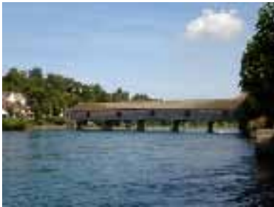
Holzbrücke bei Diessenhofen

Die letzten Orte auf der deutschen Seite sind das Landstädtchen Blumberg (10 000 Einwohner), bekannt durch seine Sauschwänzlebahn und das Dorf Fützen am Fuss des Randen. Blumberg und Schaffhausen liegen 17 km (Luftlinie) auseinander und sind durch eine Buslinie der Regionalen Verkehrsbetriebe Schaffhausen verbunden. Sowohl von Blumberg als auch von Fützen führen Strassen bis zum Klausenhof (Randenhof). Dieses Gehöft liegt 30 Minuten nördlich der Schweizer Grenze. Von Fützen benötigt man zu Fuss 1 1/2 Stunden bis zur Grenze auf dem Hohen Randen (320 Höhenmeter und 4 km). Auf der Schweizer Seite sind die Aufstiegsorte zum Hohen Randen Beggingen und Barga. Beide sind mit Bussen der Regionalen Verkehrsbetriebe Schaffhausen erreichbar. Der Aufstieg von Beggingen im Klettgau ist kürzer, aber steiler (1h 20min., 360 Höhenmeter) als der von Barga. Die auf 900 m Höhe im Wald liegende grüne Grenze kann problemlos überschritten werden, der Schlagbaum ist immer offen.